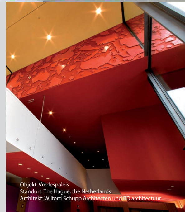
Objekt: Vredespaleis Standort: The Hague, the Netherlands Architekt: Wilford Schupp Architecten und BD architectuur

Das ROCKFON Mono® Acoustic System besteht hauptsächlich aus formstabilen Mineralwollplatten. Diese lassen sich an einem Chicago Metallic® Montagesystem oder direkt an bestehenden Decken und Wänden montieren. Sichtbare Fugen werden mit Mono Füllmasse geschlossen und dann mit anwendungsfertig gemischtem Mono Acoustic Putz über die gesamte Oberfläche verputzt, damit der Eindruck einer durchgehend fugenlosen Fläche entsteht.