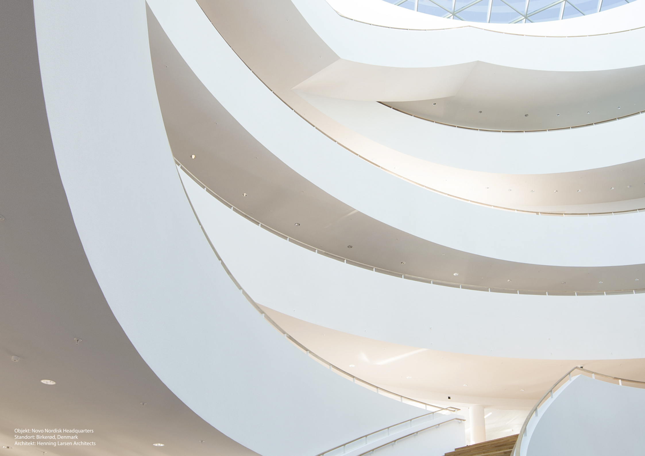
Objekt: Novo Nordisk Headquarters Standort: Birkerød, Denmark Architekt: Henning Larsen Architects