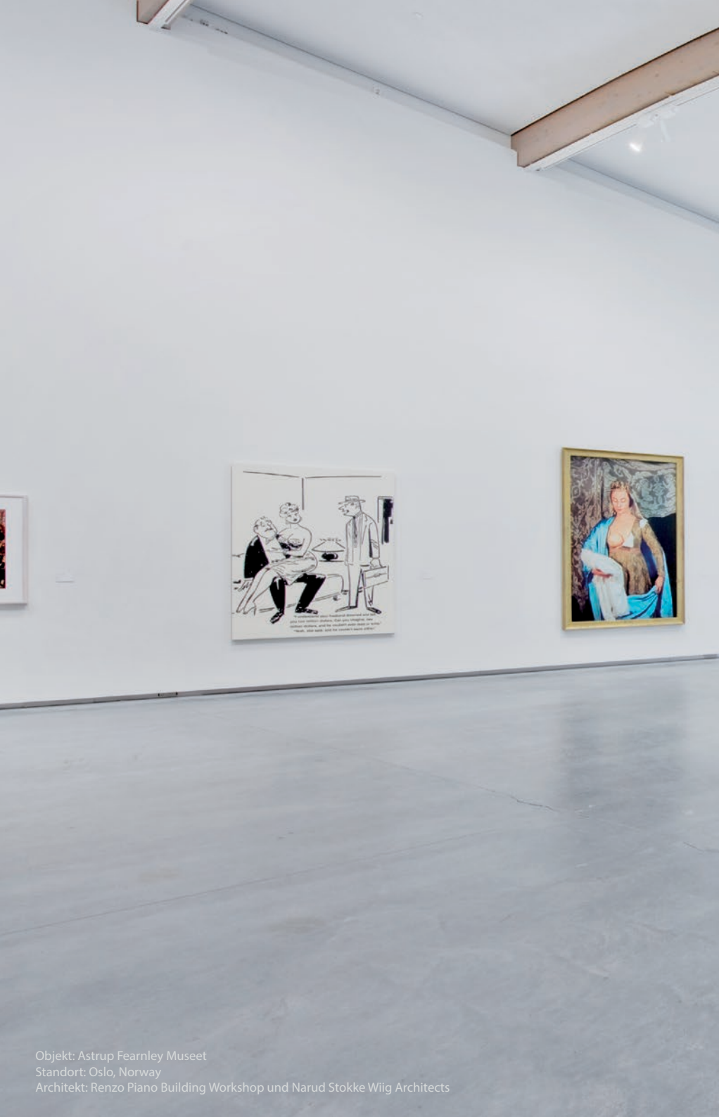
Objekt: Astrup Fearnley Museet Standort: Oslo, Norway Architekt: Renzo Piano Building Workshop und Narud Stokke Wiig Architects