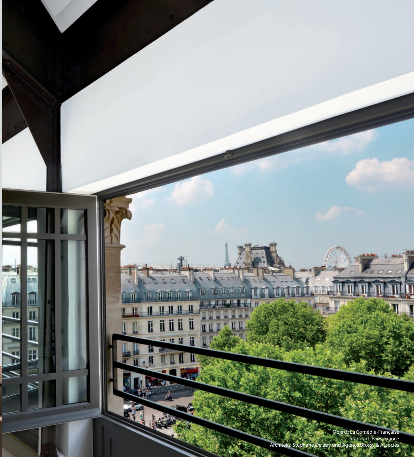
Objekt: La Comédie-Française Standort: Paris, France Architekt: Stéphane Delaby und Agence Brossy & Associés